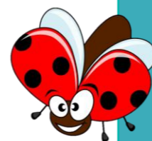
Tableau de printemps La chenille aveugle Ma couronne de printemps Plumer le poulet Ma mosaïque couleur en plâtre Le ballon chrono La course aux légumes